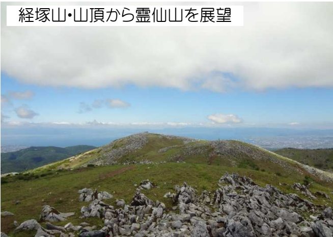
経塚山・山頂から霊仙山を展望