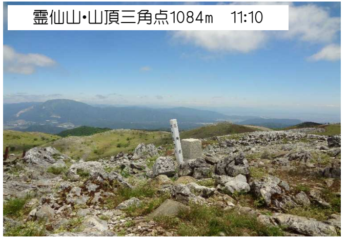
霊仙山・山頂三角点1084m 11:10