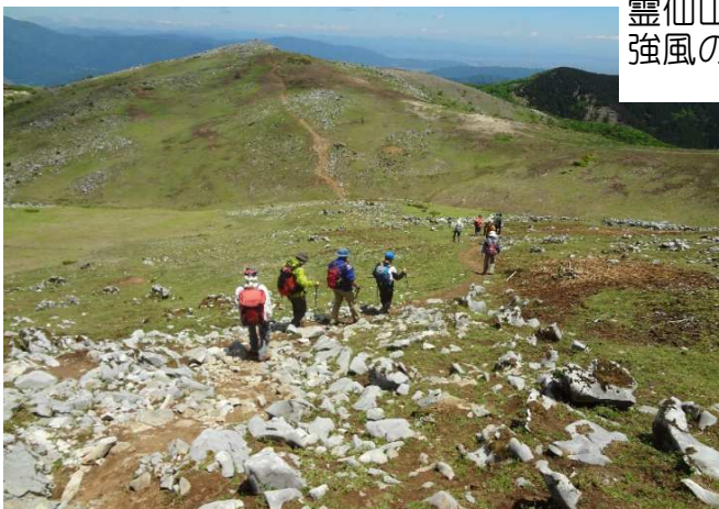
霊仙山から経塚山をみながら下山 強風のため谷間で昼食 出発12:30