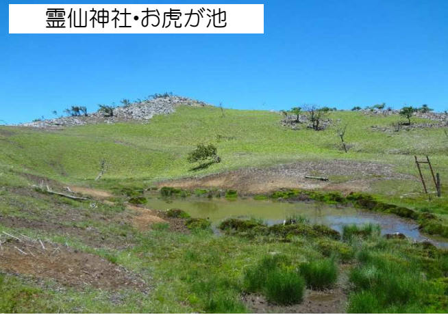
霊仙神社・お虎が池